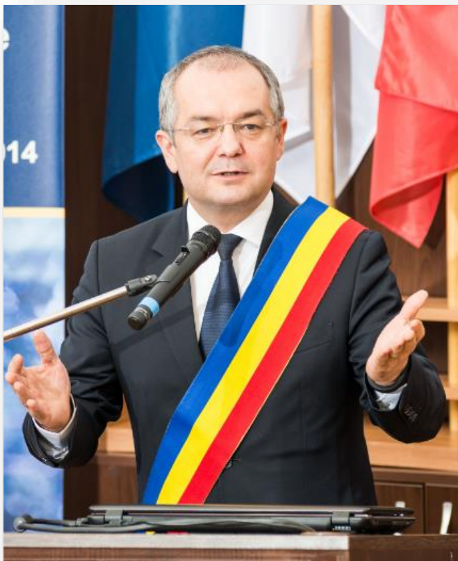
Prof. Dr. Emil Boc