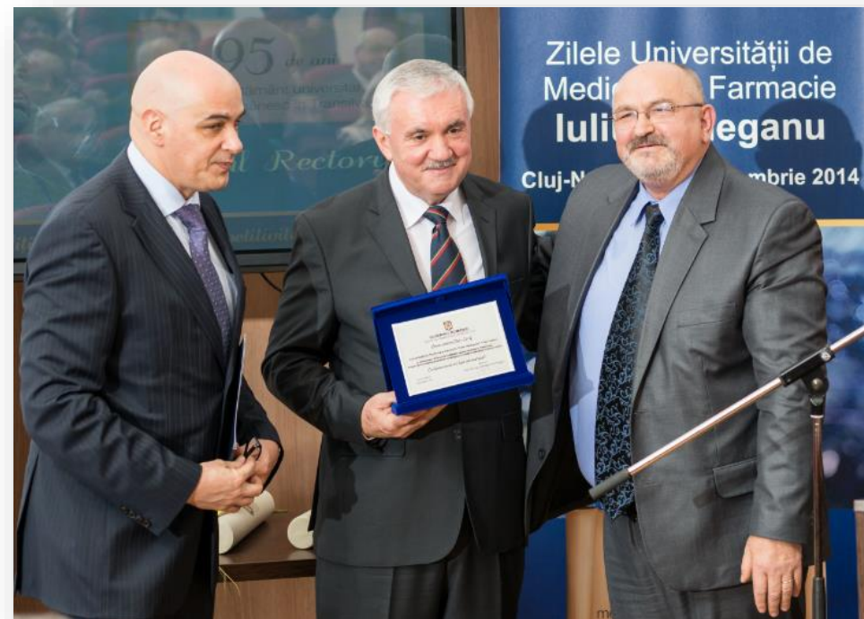
Instituția Prefectului Județului Cluj acordă UMF „Iuliu Hațieganu” Cluj-Napoca distincția „Onoare pentru Cluj 2014”

Pentru tot ceea ce reprezentați, am deosebita plăcere de a vă decerna placheta „Onoare pentru Cluj 2014”, din partea Instituției Prefectului Județului Cluj.”