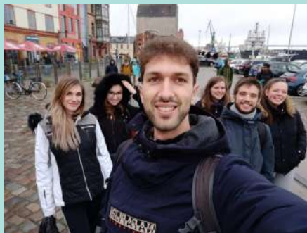
ERASMUS MEDICAL STUDENT IN ROSTOCK