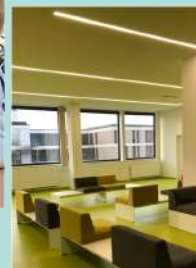
ERASMUS MEDICAL STUDENTS IN LEIPZIG